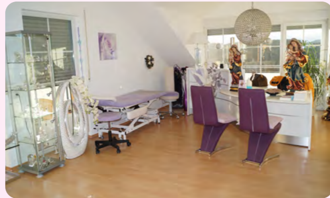
Sprech- und Behandlungszimmer