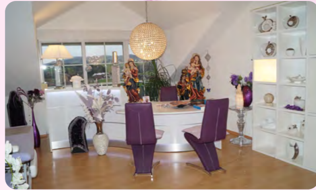
Sprech- und Behandlungszimmer